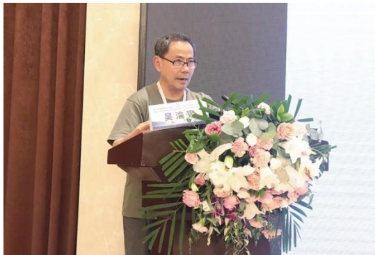
西部战区总医院神经内科主任医师 吴渝宪 教授