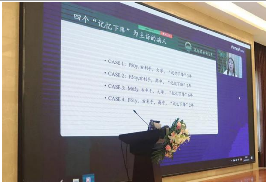
北京协和医院神经内科副主任医师 刘彩燕 教授