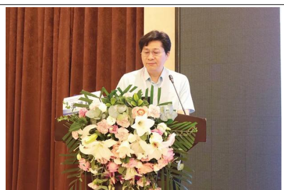
南方医科大学南方医院神经内科主任 潘速跃 教授