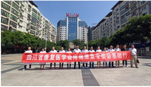
平昌县人民医院义诊活动

康复同道现场技术示范，还开展了专题学术讲座，交流培训 60 余人。疼痛康复专委会积极开展健康基层行义诊活动，为推动四川疼痛康复发展做出成绩。