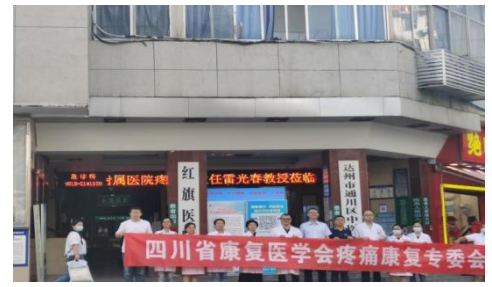
通川区中医医院义诊活动